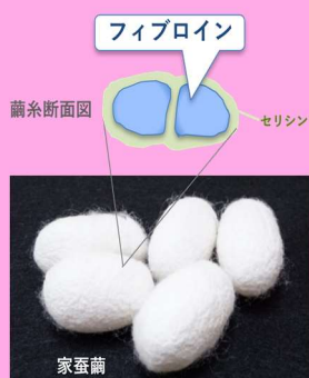
シルクフィブロイン上の細胞は特徴的な挙動を示す

■概要：桑の葉を食べて育つ蚕(Bombyx mori)が低環境負荷のプロセスにより高効率に合成・紡糸する繭から得られる繊維性高分子を家蚕シルクフィブロイン(以下シルク)と呼ぶ。このシルクからなる繊維は、優美な光沢や柔らかな風合い、美しいドレープ性、優れた強度・吸湿性保温性、また多彩な染色性を示し、古くから高級衣服等に利用されている。さらにシルクは外科手術用の非吸収性縫合糸としても長らく使用されている実績をもつ。古くから重用されてきたシルクの特性をさらに解明し、また、その優れた性質を低減させることのない手法により新たな機能性を付与し、医用材料としてヒトに優しいシルク材料の開発を進めている。