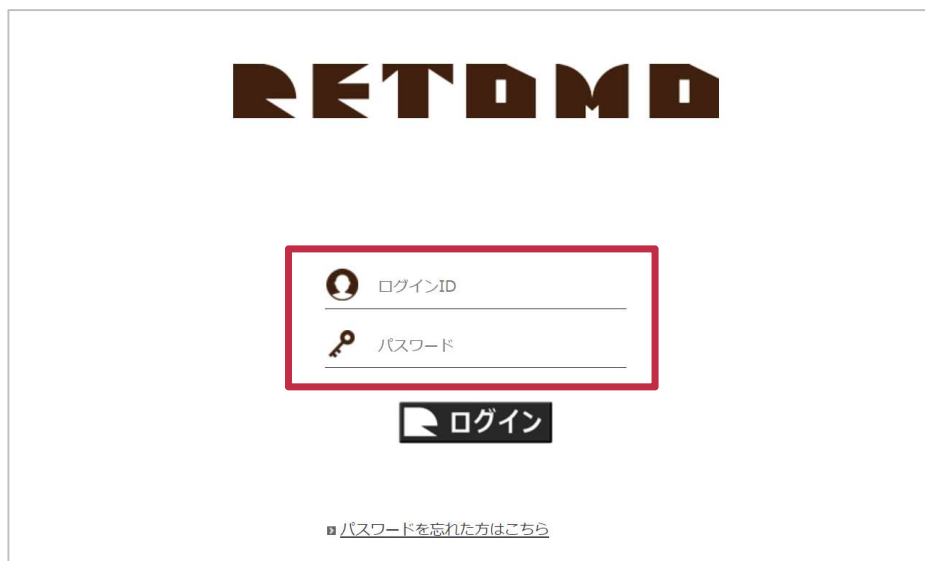
●ログイン画面イメージ